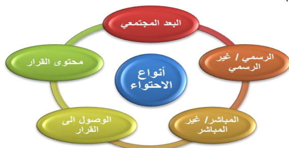
شكل (١) يوضح انواع الاحتواء

وبالنسبة لأنواع الاحتواء العالي: يمكن تقسيم الاحتواء الى خمسة أنواع هي (Naji, 2020,109):